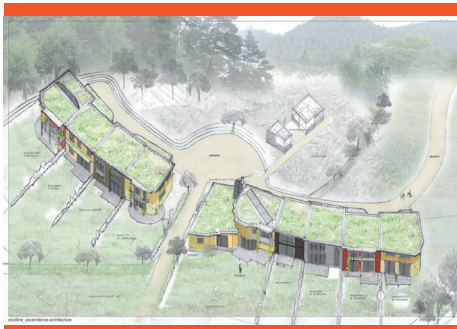
Projet Ecolline, Saint-Dié des Vosges

Unissons nous pour construire ensemble l'habitat de demain, autrement.