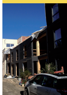
Unisson, Montreuil (Avec A-Tipic)

Collectif de six familles souhaitant intégrer une mixité sociale, un voisinage solidaire dans le respect de l'intimité et des différences culturelles de chacun.