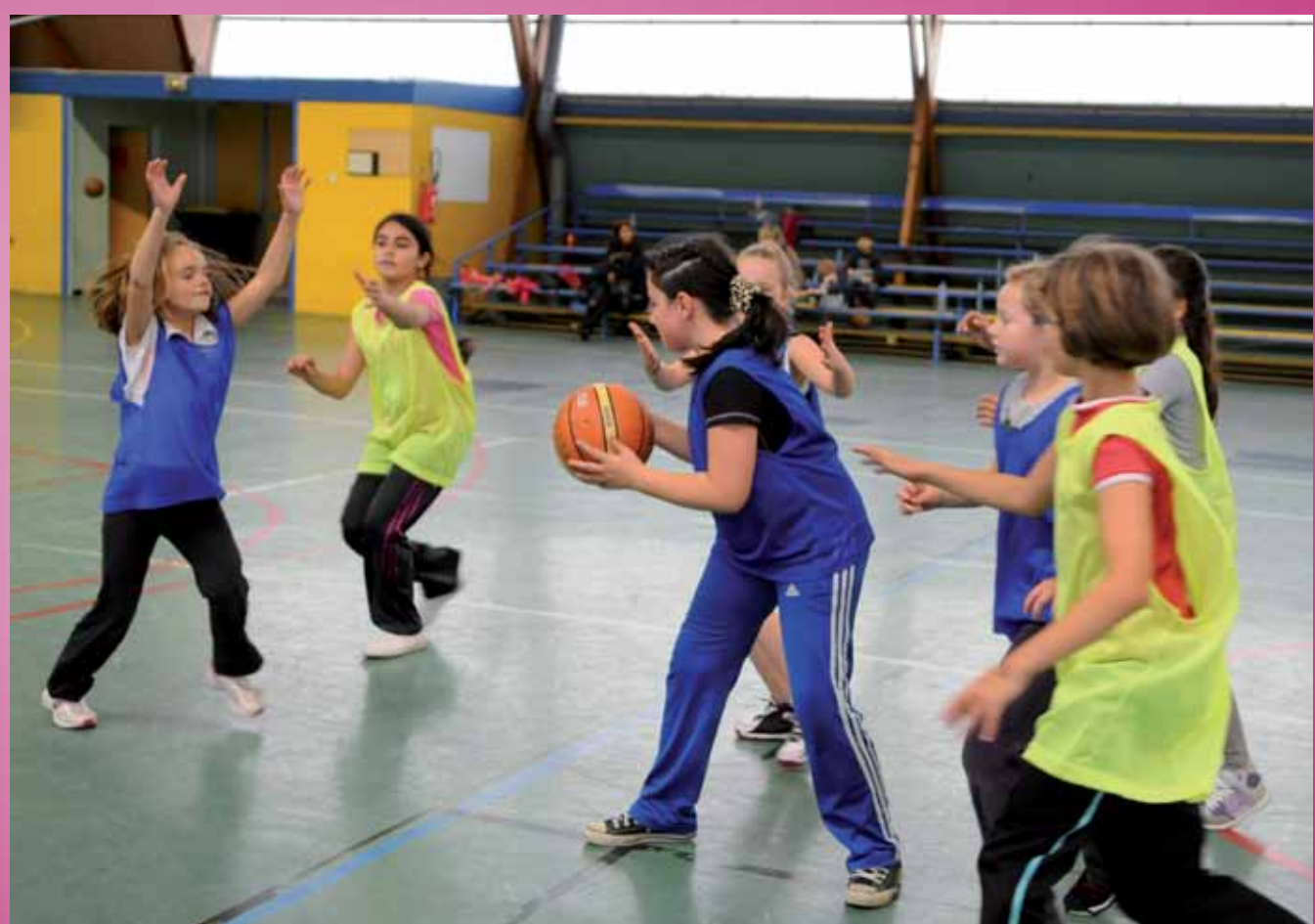
Rester solidaires, la clé du succès - le FOLCLO