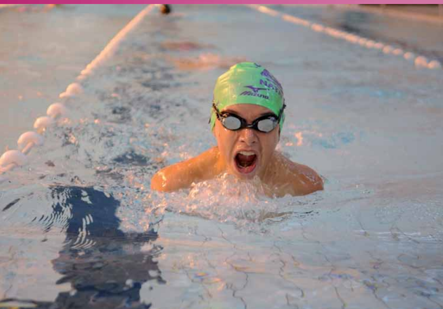
Apprendre à se dépasser - Lorient natation