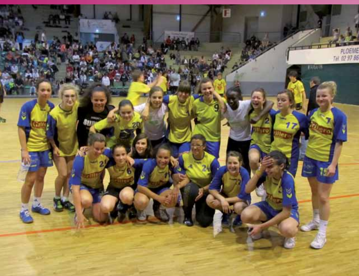
Faire appel à la dynamique de groupe pour gagner Lorient handball club, équipe féminine des moins de 18 ans

Économie Sociale Economie sociale et Solidaire