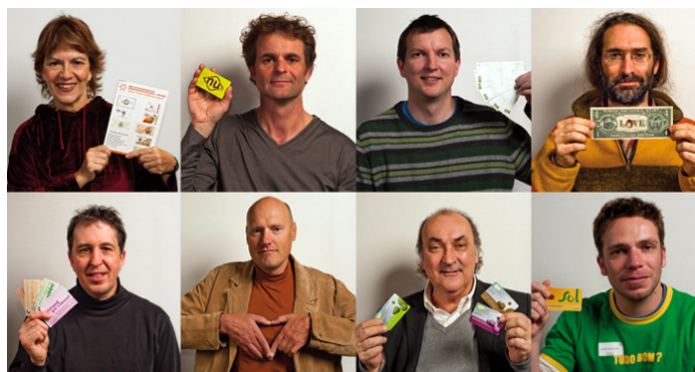
Echanger autrement ! panorama des monnaies complémentaires et sociales fokus21

Lors de la Journée d'échanges du 9 novembre, vous aurez le plaisir de découvrir ou redécouvrir une exposition photographique de 18 portraits emblématiques , parmi les 4 000 monnaies existantes dans le monde. Chaque créateur ou porteur de monnaie pose avec son système d'échange (billet, téléphone, carte à puce...) dont l'objectif est de remettre de l'abondance, de la diversité, du lien, de la démocratie et de l'humain dans l'économie.